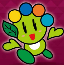
太田市マスコットキャラクター「おおたん」