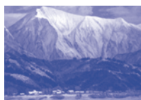
永井昭司《斜光・胸ヶ岳》